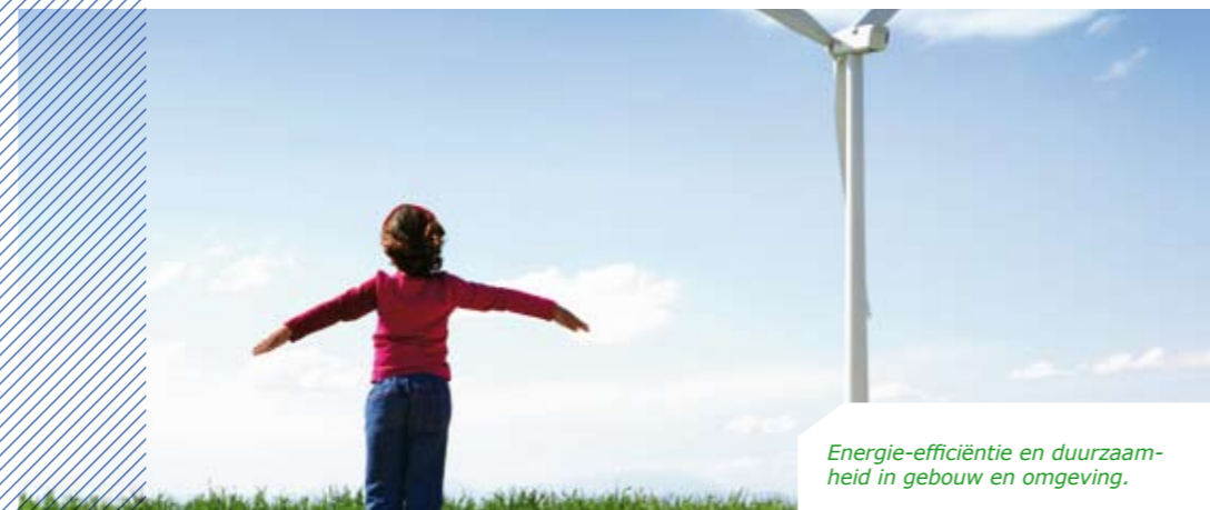
Energie-efficiëntie en duurzaamheid in gebouw en omgeving.

Klimaat en Beleid is onderdeel van BuildDesk, een onderneming met een missie: energie-efficiëntie en duurzaamheid in gebouw en omgeving door het uniek verbinden van mensen, kennis en ervaring. Samen met onze klanten werken wij aan regionale en lokale antwoorden op het mondiale vraagstuk van klimaatverandering.