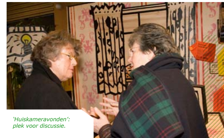
'Huiskameravonden': plek voor discussie.

In de gemeente Breda heeft BuildDesk juist een aanpak op wijkniveau ontwikkeld. Deze campagne was gericht op vijfhonderd particuliere huiseigenaren in Breda en had als doel de huiseigenaren energiebesparende maatregelen aan de eigen woning te laten nemen. Het