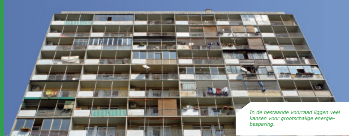
In de bestaande voorraad liggen veel kansen voor grootschalige energiebesparing.

Gemeente en woningcorporaties werken vaak samen om de energievraag binnen de gemeente terug te brengen. Hiervoor worden prestatieafspraken gemaakt en energieconvenanten afgesloten.