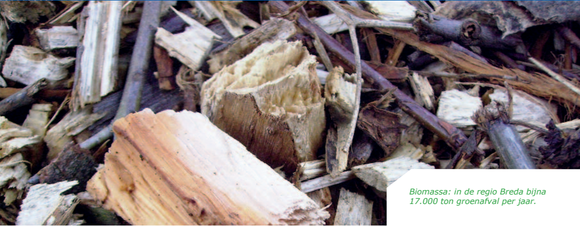
Biomassa: in de regio Breda bijna 17.000 ton groenafval per jaar.