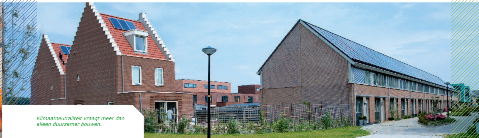
Klimaatneutraliteit vraagt meer dan alleen duurzamer bouwen.