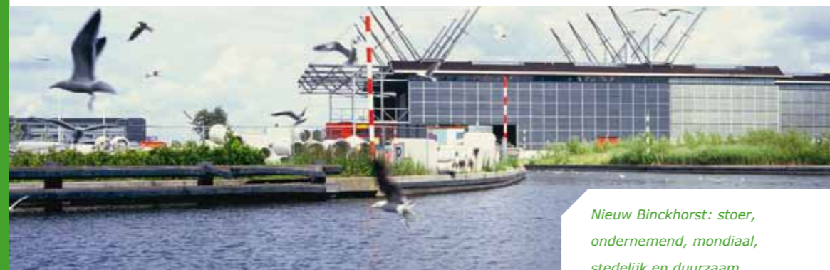
Nieuw Binckhorst: stoer, ondernemend, mondiaal, stedelijk en duurzaam